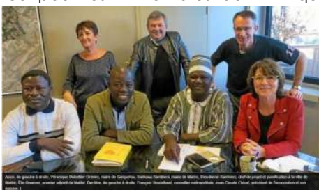
La délégation de Matéri et leurs hôtes