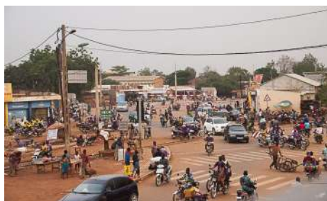
Pagaille au passage à niveau de Bohicon

Deux autres petites lignes reliant Cotonou à Pobe (107 km) et à Segbohoulé (60 km) ont vu leur trafic suspendu dans les années 90.