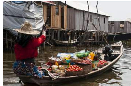
En 'route' pour le marché flottant

Enfin, il ne faut pas oublier le déplacement, parfois à vélo, le plus souvent à pied pour une partie importante de la population n'ayant pas les moyens de s'acheter un véhicule ou de payer un transport.