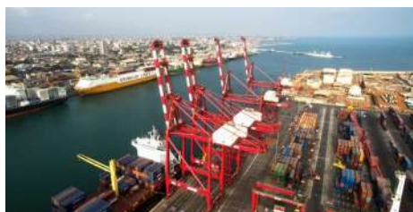
Le port de Cotonou

Le port de Cotonou est l'un des plus grands ports de l'Afrique de l'Ouest. Environ 2 000 bateaux accostent chaque année pour charger ou décharger plus de 10 millions de tonnes de fret (conteneurs, pétrole, céréales, huile végétale, bois, coton, ...).