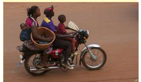
Le zem est un vrai transport en commun

Il n'est pas rare de voir 3 adultes sur la moto quand ce n'est pas avec 1 ou 2 enfants en plus, auxquels il faut ajouter toutes sortes de marchandises ! Le chauffeur est sensé posséder un casque mais rarement les passagers.