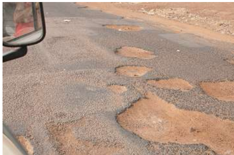
Ici, on évite de rouler à droite !

L'une des conséquences est l'accidentologie alarmante (plus de 3000 accidents faisant 700 morts et 6000 blessés par an). À Cotonou, ce sont les jeunes et les '2-roues' qui paient le plus lourd tribut. Dans le reste du pays, beaucoup d'accidents touchent les mini-bus surchargés (en passagers et marchandises) et en mauvais état technique mais la vitesse reste la cause première des accidents les plus graves. Les poids-lourds également trop chargés et insuffisamment entretenus sont aussi très dangereux.