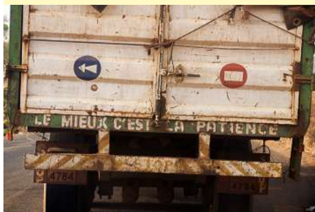
À l'arrière des véhicules, de nombreuses sentences

En bleu : nationales bitumées En rouge : nationales en terre