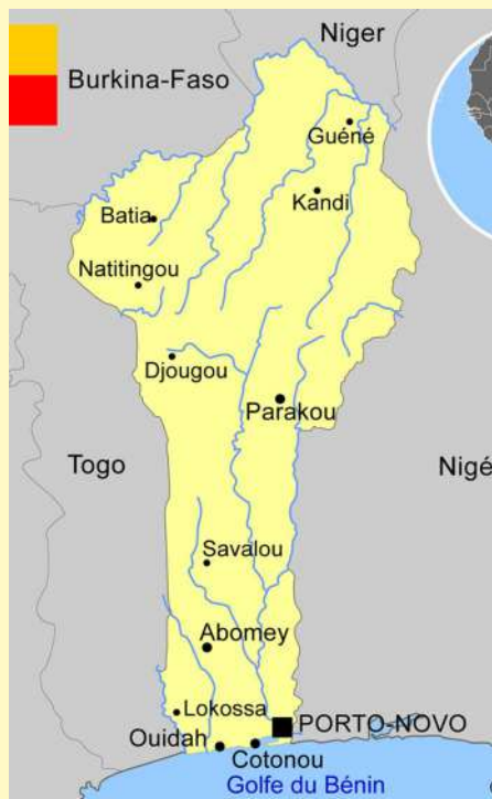
Principaux fleuves du Bénin