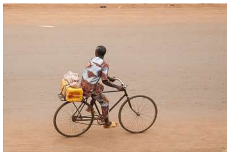
On est bien loin du VTT

Dans la campagne, on voit un grand nombre d'enfants qui fréquentent les établissements scolaires souvent situés à plusieurs kilomètres ou des femmes qui se rendent aux champs, au marché, portant de lourdes charges sur la tête.