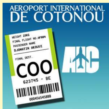
Logo de l'aéroport de Cotonou