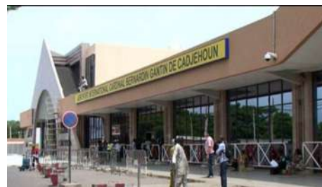
Aéroport de Cotonou

Pour le transport aérien intérieur et vers les pays limitrophes, le Bénin possède également 8 autres aéroports ou aérodromes (Parakou, Djougou, Natitingou, Kandi ...).