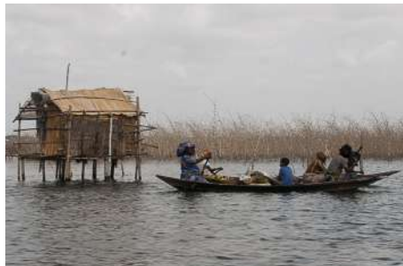
Pêche sur le lac de Nokoué

L'Ouémé dont une branche passe par le lac de Nokoué est le seul fleuve navigable, en saison des pluies. Sur le lac lui-même (qui a un accès à l'océan), de nombreux petits bateaux de pêche et des bateaux de transport de marchandises assurent l'approvisionnement de la ville lacustre de Ganvié.