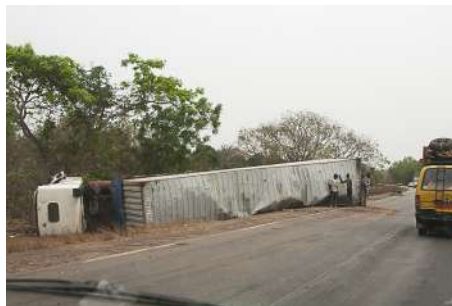
Un camion en facheuse posture...

L'état des routes couvertes de nids de poule(s) peut s'expliquer par la fréquentation importante de poids-lourds surchargés assurant la liaison nord-sud et par la période pluvieuse qui s'étend de mai à octobre dans le centre et le nord du pays. Le nouveau gouvernement a lancé de nombreux projets (plutôt dans le sud dont la "Route des Pêches").