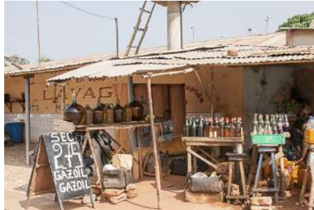
Vente de carburant de contrebande

Fin août 2017, le directeur général des infrastructures reconnaissait le mauvais état du réseau routier. Les travaux ne pouvant se faire en saison des pluies, nul doute qu'il n'a pas dû s'arranger en 4 mois. Les différentes missions de BNV organisées chaque année ont pu se rendre compte des progrès faits dans quelques secteurs du sud mais aussi de la dégradation pour l'axe Dassa – Djougou.