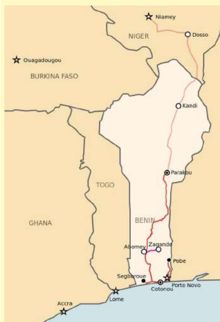
Lignes ferroviaires (actuelles et future)