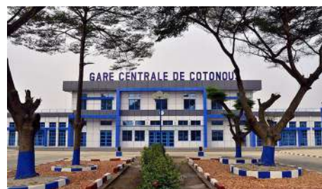
La gare rénovée de Cotonou

Le réseau ferroviaire est très peu développé puisque le Bénin ne possède qu'une seule ligne de chemin de fer, à écartement métrique, d'une longueur de 438 km, qui relie Cotonou à Parakou. Elle sert quasi-exclusivement au transport de marchandises.