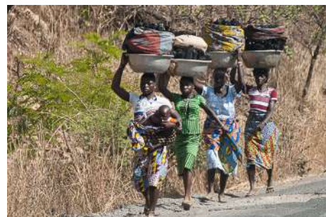
La route vers le marché est parfois longue