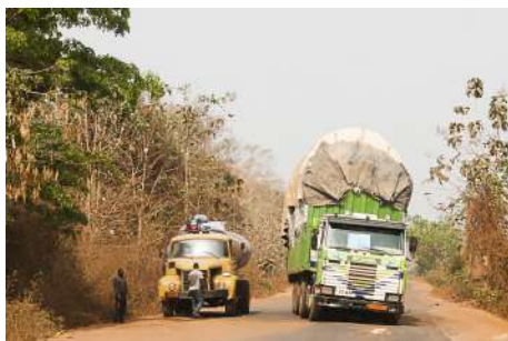
Mieux vaut se faire tout petit...