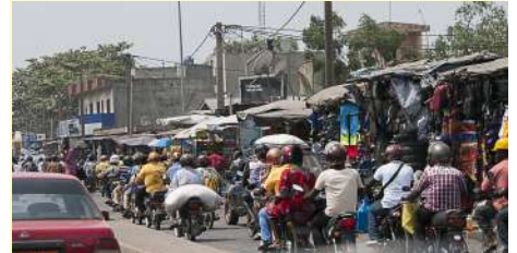
La circulation à Cotonou est très dense

Les "zémidjans" ('emmène-moi vite' en fongbe), appelés communément zems, sont des motos-taxis très nombreuses dans Cotonou et les principales villes du Bénin. On estime leur nombre à un demi-million dans le pays dont 150 000 pour Cotonou. De plus en plus, les motos chinoises remplacent les modèles européens ou japonais.