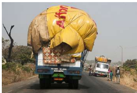
Chargement habituel d'un camion