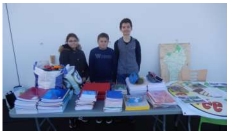
La collecte des collèves

Le 12 octobre dernier, comme chaque année, a eu lieu le cross des collèves à Montaigu. Les deux établissements (Jules Ferry et Michel Ragon) s'étaient donné rendez-vous au complexe sportif Léonard de Vinci. Notre association y était invitée pour la deuxième année.