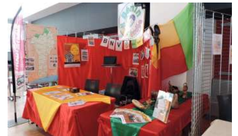
Le stand BNV