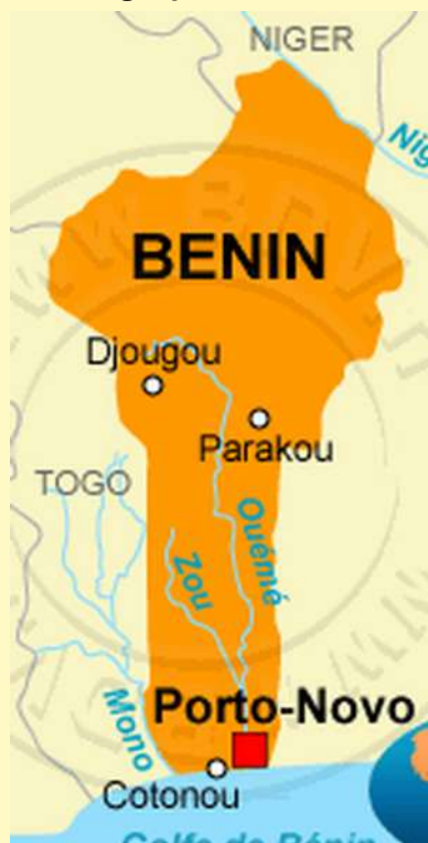
Principaux aéroports du Bénin