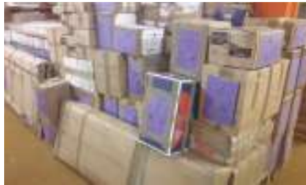
4 m3 des colis divers

Le matériel et des manuels scolaires feront certainement, même si ce n'est qu'en quantité limitée, le bonheur des élèves et de leurs professeurs concernés, au collège et dans les écoles maternelle et élémentaires. Déjà d'autres séries de livres sont arrivées pour le conteneur d'octobre 2018 !